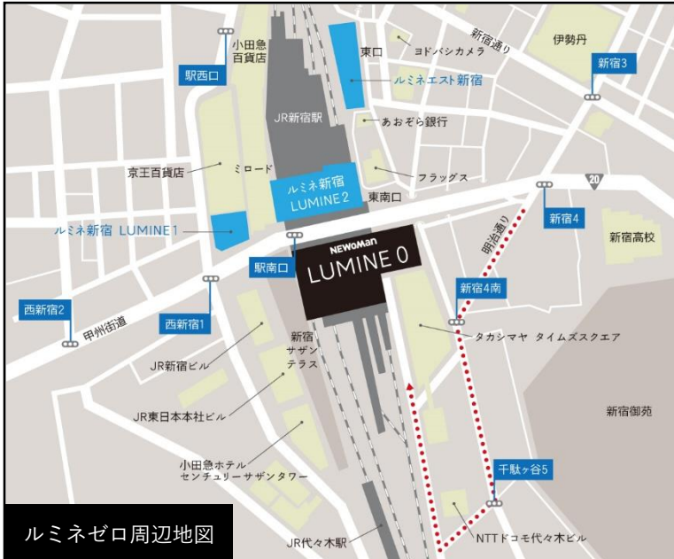
ルミネゼロ周辺地図

明治通りを代々木方面へ。高島屋さまを右手に見て、2つ先の交差点「千駄ヶ谷五丁目」を右折。 更に突き当たりを右折頂ぎ、進むと入口がございます。 ※ 高島屋さま駐車場と共通入口です。